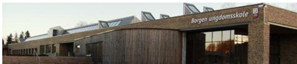
Borgen Skole som DeltaTek AS har energivurdert.